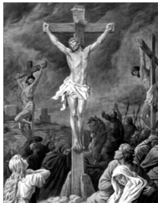
▲ Распятие Христа

поцеловал его, тем самым указав стражникам на него. Иисуса схватили, подвергли побоям и оскорблениям. После этого его привели на иудейский суд, где Иисус подтвердил, что он — Мессия. Его объявили самозванцем, обвинили в богохульстве и приговорили к позорной смертной казни — распятию на кресте. Однако прокуратор Понтий Пилат, римский правитель Иудеи, проникся сочувствием к Иисусу, так как не уви-