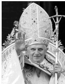
▲ Папа римский Бенедикт XVI

Вселенская церковь состоит из отдельных церквей — территориальных сообществ католиков, границы которых