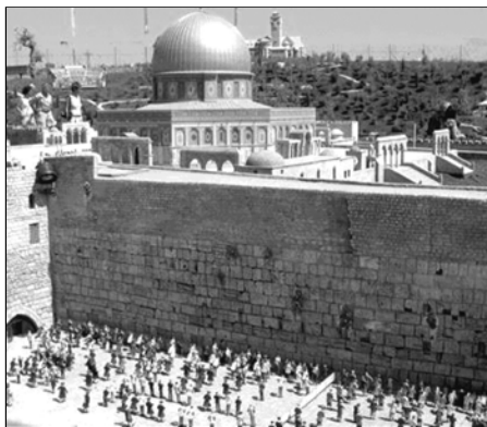
▲ У Стены Плача в Иерусалиме

Ныне от Иерусалимского храма — одного из самых величественных религиозных сооружений в истории человечества — сохранилась только часть западной стены, известная во всем мире как Стена Плача. Сегодня множество людей — жителей Израиля и приезжих