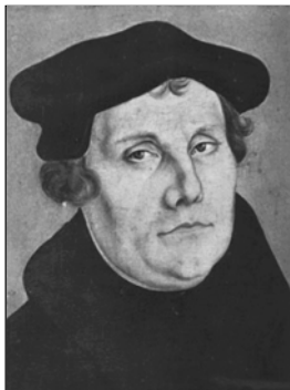
▲ Мартин Лютер

индальгенций». 31 октября 1517 года Мартин Лютер прикрепил этот документ к дверям университетской церкви в Виттенберге.