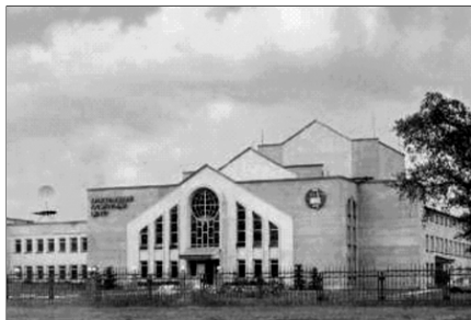
▲ Центр адвентистов в Нижнем Новгороде

◄ Адвентисты. Первая в России община адвентистов была образована в Крыму в 1886 году среди немецких колонистов, а русская община появилась в 1890 году в Ставрополе. Однако против учения адвентистов выступили православная церковь, баптисты и лютеране.