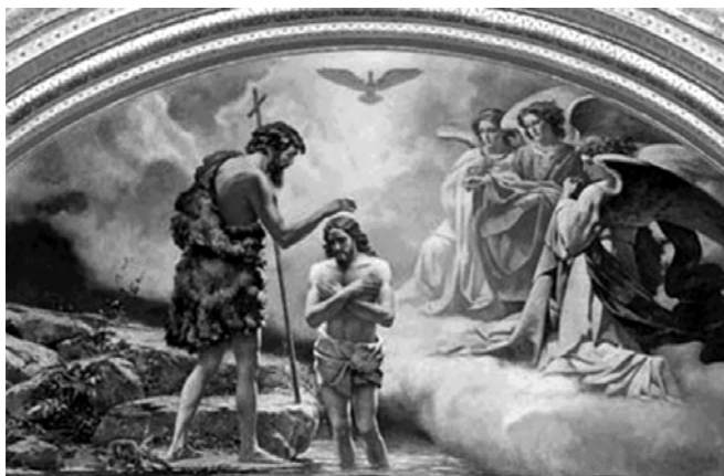
▲ Крещение Иисуса Христа. Фрагмент росписи храма Христа Спасителя, авт. воссоздания К. И. Нестеренко

Затем Иисус на 40 дней удалился в пустыню и предался молитве, размышлению и посту. Во время поста его искушал Сатана, обещая за отступничество все блага