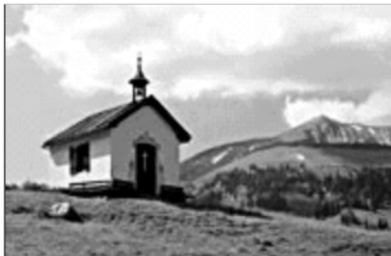
▲ Храм адевентистов

ники, то есть адвентисты, исповедующие свою веру и ведущие соответствующий образ жизни.