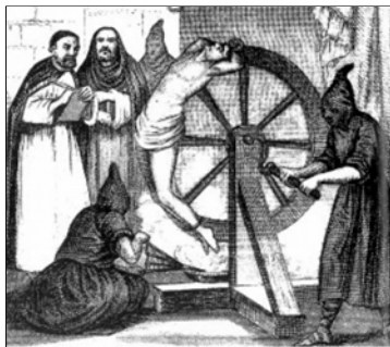
▲ Пытка обвиняемого в инквизиции

Инквизиторы подчинялись папе римскому, только он мог изменить вынесенный ими приговор. «Пособием» инквизиторов была книга «Молот ведьм», в которой со ссылками на Священное Писание доказывалась необходимость жесточайшей расправы с еретиками, колдунами, ведьмами. Обвинению, пыткам и казни подвергались не только про-