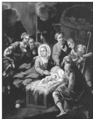
▲ Рождение Иисуса. Миниатюра неизвестного автора

На восьмой день после рождения, согласно иудейскому закону, мальчика понесли в Иерусалимский храм для посвящения Богу. Вскоре несправедливый и жестокий царь Ирод узнал о приходе в мир Мессии и, чтобы погубить его, приказал убить всех младенцев, родившихся в окрестностях Вифлеема. Родители с маленьким Иисусом бежали в Египет. Когда же Ирод умер, семья вернулась в родные края, в город Назарет. Свои детские и юношеские годы Иисус провел в этом городе, поэтому его часто называют Назарянином.