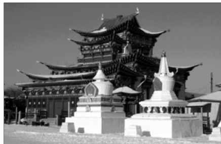
▲ Иволгинский дацан в Бурятии

В 1930-е годы в СССР действовало 47 бурятских дацанов, в которых проживало около 10 тысяч лам и послушников, 28 калмыцких монастырей (3 тысячи духовных лиц), 19 тувинских монастырей (3 тысячи лам и послушников).