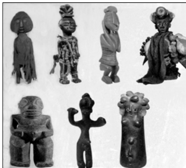
▲ Талисманы и амулеты

Фетишем мог стать любой предмет, который, как считал человек, однажды принес ему удачу. Древние люди верили в то, что фетиш может защищать от болезней, нечистой силы, способствовать успеху на охоте и т. п. Некоторые предметы, обладавшие, как полагали люди, магической силой и оберегавшие своего хозяина от бед и несчастий, стали называть амулетами (с лат. — отстранять, отвращать). Магическую силу приписывали также талисманам (с греч. — посвящение). Различие заключалось в том, что амулеты носили открыто, а талисманы прятали от посторонних глаз. Фетиш мог иметь не только личный, но и общественный характер, то есть оберегать и защищать все племя (гора, дерево, валун и др.). Позднее люди стали создавать искусственные фетиши.