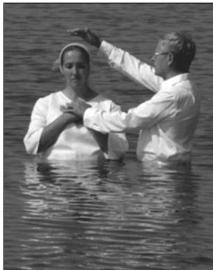
▲ Крещение баптистов

5. Адвентизм В 30-х годах XIX века от баптизма отделилось новое протестанское направление — адвентизм (с лат. — пришествие). Сторонники его называют себя «Адвентисты седьмого дня». В основе их веры лежит учение о конце света. Адвентисты утверждают, что наш мир вскоре будет уничтожен огнем, а для верующих будет создана новая земля. Основным догматом адвентистов — догмат о скором пришествии на землю Иисуса Христа. После второго пришествия Христа произойдет воскресение людей, но воскреснут только правед-