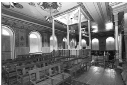
▲ Синагога в Дербенте

Человек, возглавляющий автономную еврейскую религиозную общину, называется раввин . Становление института раввинов происходило в Средневековье, когда местные еврейские общины начали самостоятельно избирать себе духовного руководителя. Ему присваивалось это звание, которое указывало на ученость и авторитет избранного.