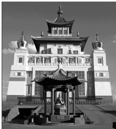
▲ Буддийский храм

Во время молебна читаются молитвы и тексты священных книг, проводятся очистительные ритуалы, об-