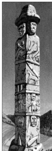
▲ Збручский идол

Осваивая новые территории Восточно-Европейской равнины, восточные славяне практически не встречали естественных преград, что облегчало им продвижение. В ходе своего развития и расселения они вступали в тесные контакты