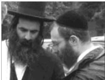
▲ Евреи в традиционных головных уборах

Иудейское богослужение состоит из индивидуальной и общей молитвы, чтения Торы, исполнения религиозных песнопений. Благочестивый еврей молится трижды в день: утром, в полдень и вечером. Основная молитва — «Шма» — состоит из трех библейских отрывков. Молящиеся сидят на креслах, стульях