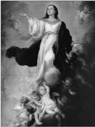
▲ Вознесение Богородицы. Мурильо, Бартоломе Эстебан (Испания)

В католической церкви индульгенция — это «отпущение перед Богом временной кары за грехи». В эпоху Возрождения практика предоставления индульгенций за денежные пожертвования нередко приводила к значительным злоупотреблениям. Торговля индульгенциями обогатила церковь, но подорвала ее духовный авторитет.