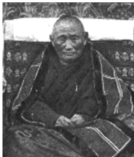
▲ Хамбо-лама Агван Доржиев

лаем II ему удалось добиться согласия государя на строительство в Петербурге буддийского храма. Проект храма был подписан архитектором Г. В. Барановским, но работал над ним сам Доржиев.