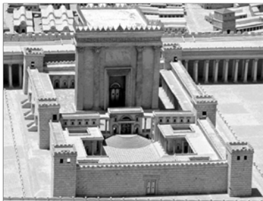
▲ Иерусалимский храм (реконструкция)

Царь Соломон прославился своей великой мудростью и справедливостью в решении самых сложных вопросов. В 945 году он начал строительство Иерусалимского храма, ставшего символом служения еврейского народа Всевышнему.