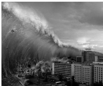
▲ Грозная стихия — цунами

◀ Познавательные причины религиозности обусловлены тем, что с древних времен человека окружали неизвестность, многочисленные необъяснимые явления, он испытывал страх перед грозными, непокорными ему силами природы. Не только в древности, но и сегодня наука не в состоянии дать ответы на многие вопросы об окружающем нас мире. Но пытливый ум человека не согласен мириться с неизвестностью и пытается найти ответы на все нерешенные вопросы. Интерес к необъяснимому, стремление понять его, объяснить наличием сверхъестественных сил создают благоприятные причины для появления религиозности.