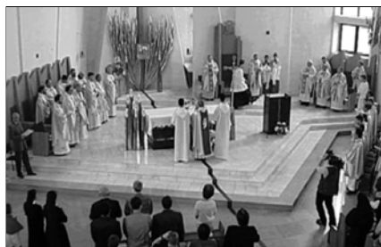
▲ В католическом храме

Сердце храма — дарохранительница. Это шкафчик или ниша с дверцей, где хранится освященный хлеб, символизирующий Тело Христово. Дарохранительница увенчивается кивотом — навесом на четырех столбах, где всегда горит маленькая лампада. Дарохранительница находится на алтаре или рядом с ним. В части помещения храма, предназначенной для прихожан, стоят скамьи или