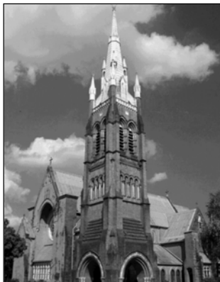
▲ Здание англиканской церкви

церковной организации. Эта «реформация сверху» привела к установлению некой «средней линии» в новой религии между католичеством и протестантизмом. В англиканской церкви, как и в католической, сохраняется церковная иерархия. В ней главенствуют два архиепископа: Кентерберийский и Йоркский. Архиепископ Кентерберийский считается примасом (первым) — фактическим главой англиканской церкви. Формально же в ней главенствует король или королева. Особенностью англиканства является то, что идея о спасительной роли церкви (утверждаемая католицизмом) сочетается в нем с идеей о спасении личной верой (которую отстаивает протестантизм).