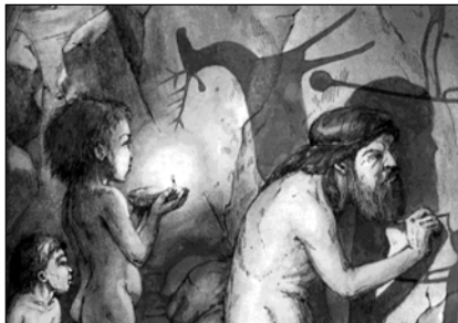
▲ В первобытной пещере

На чем было основано магическое мышление? Ученые выделяют два закона, которые лежали в основе его: закон подобия и закон заражения.