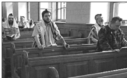
▲ Еврейская хоральная синагога в Москве

В современной России иудаизм представлен тремя крупными течениями: ортодоксальным иудаизмом, хасидизмом, современным иудаизмом. Наиболее влиятельны