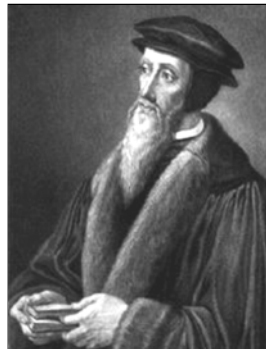
▲ Жан Кальвин

Почему же Реформация имела большой успех? В XVI веке феодальные отношения в Европе переживали глубокий кризис. Нарождались новые, капиталистические, общественные отношения, в которых главным становился человек свободный, инициативный, предприимчивый. Католическая же церковь защищала старые порядки и по-прежнему придерживалась требования полного духовного контроля над верующими.