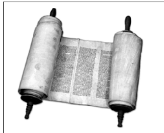
▲ Свиток Торы

нелегко, вес свитка может достигать 10—15 кг. Со словами: «Это Тора, которую Моисей дал детям Израиля по слову Бога», — показывают присутствующим несколько строк Торы. Потом напевают один из отрывков. В субботу к этому добавляются чтение из книги Пророков. Чтение из книги Писаний совершается в праздничные дни.