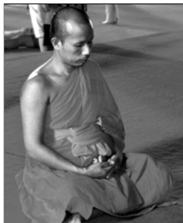
▲ Буддийский монах в состоянии медитации

Особое значение придается телесным останкам и вещам Будды (локон, волосы бровей, часть пепла погребального костра, зуб, чаша для подаяний и др.). Для этих святых стали строить часовни — ступы , круглые