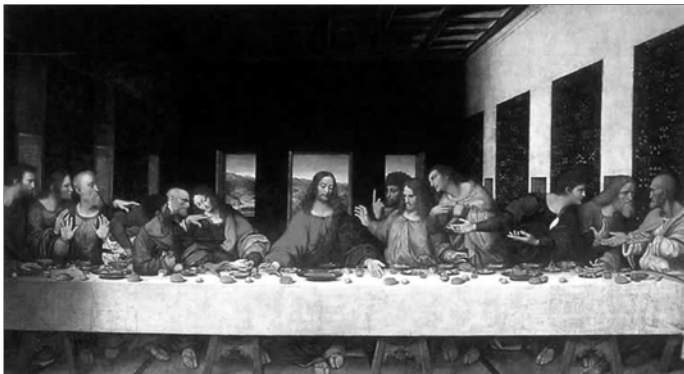
▲ Леонардо да Винчи. Тайная вечеря (фреска)

Так началась последняя неделя земной жизни Иисуса Христа — Страстная , или Великая . Каждый ее день имеет особый смысл и особое значение для всех верующих-христиан.