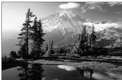
▲ Как прекрасен этот мир...

Жизнь верующего человека наполнена религиозными представлениями (о Боге, Царстве Божием), чувствами (восхищения, удивления), эмоциями, настроениями (положительными, отрицательными).