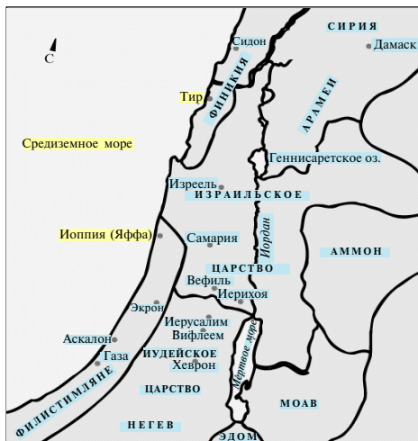
▲ Древняя Палестина, 800 до н. э.

Что происходило с человечеством до возникновения еврейского народа? Согласно библейской истории, первым человеком был Адам. Бог из ребра Адама сотворил Еву, его жену. Первые люди жили в раю и ни в чем не нуждались. Но, как известно, поддавшись на уговоры Сатаны, явившегося им в образе змея, они вкусили запретный плод с дерева познания и потеряли доверие Бога, своего Создателя. В наказание они были изгнаны из рая на землю, где им пришлось самим строить свою трудную, полную лишений и страданий жизнь. Сын Адама и Евы Каин совершил страшный грех — братоубийство. Брат Авель пал жертвой зависти Каина. С каждым поколением люди все больше отдалялись от Бога, совершали все больше тяжких грехов. И наконец Бог решил уничтожить человечество, погрязшее в грехе и пороке. Воды Великого потопа погубили всех людей. Только семья праведника Ноя получила спасение. Ной должен был стать родоначальником нового человечества, которое Бог обещал не уничтожить. Однако зло не исчезло из жизни людей, и они вновь отвернулись от Бога. И тогда Бог заключил союз с Авраамом — договор о рождении нового, богоизбранного народа.