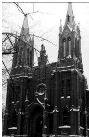
▲ Католический храм в Смоленске

При императоре Александре I в 1820 году за активную пропаганду католицизма была запрещена деятельность ордена иезуитов в России. В 1847 году, при Николае I, подписан конкордат (с лат. — нахожусь в согласии), то есть государственный договор между Россией и Римом, значительно расширявший власть папы над католическим духовенством в России. Но после подавления Польского восстания (1863—1864 гг.) все отношения российского государства с Римом были разорваны.