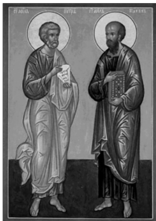
▲ Апостолы Петр и Павел (икона)

Время шло, и сторонников христианства постепенно становилось все больше. Римский император Константин I, мудрый и дальновидный политик, увидел в христианстве возможность укрепить свою власть, ведь оно призывало народ подчиняться властям и признавало власть одного правителя. В 311 году Константин I объявил христианство законным, и гонения на христиан прекратились. С 313 года любой житель империи по своему желанию свободно мог перейти в христианскую религию. В 324 году христианство провозглашается господствующей религией Римской империи, однако новая вера утвердилась не сразу, особенно на окраинах. Так, только в конце IV века при императоре Феодосии I Вели-