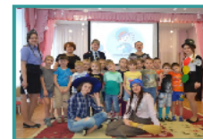
Из опыта работы МБОУ СОШ № 10, г.Арзамас