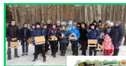
Из опыта работы МБОУ СОШ № 14, г.Арзамас

В пяти школах – участниках проекта созданы Советы отцов!!