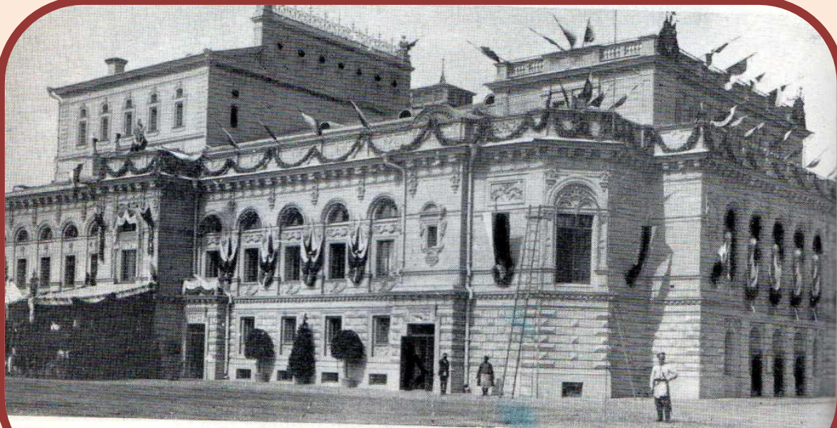
Новый театр в дни открытия в 1896 году

Вскоре театр прочно вошел в быт широких слоев населения.