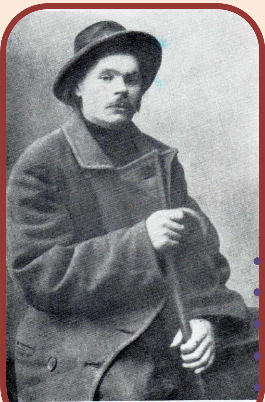
Алексей Максимович Горький в 1901 году