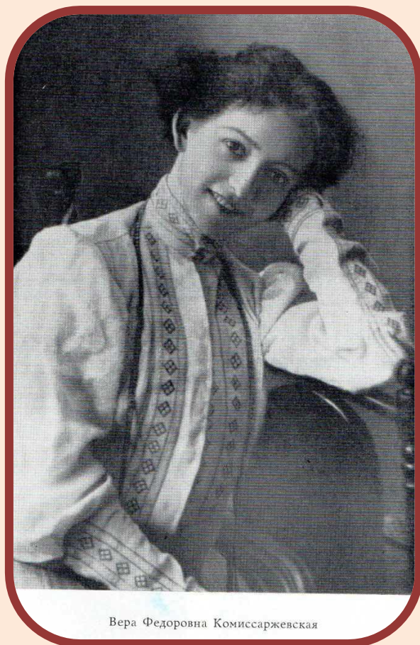
Вера Федоровна Комиссаржевская

• Глава четвертая повествует о начале нового периода Нижегородского театра, когда русская драматургия обогатилась драматургией А. М. Горького: в репертуаре появились пьесы «Мещане», «На дне», «Дачники», «Дети солнца».