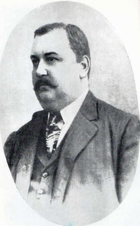
Константин Николаевич Незлобин в 1900—1902 годах