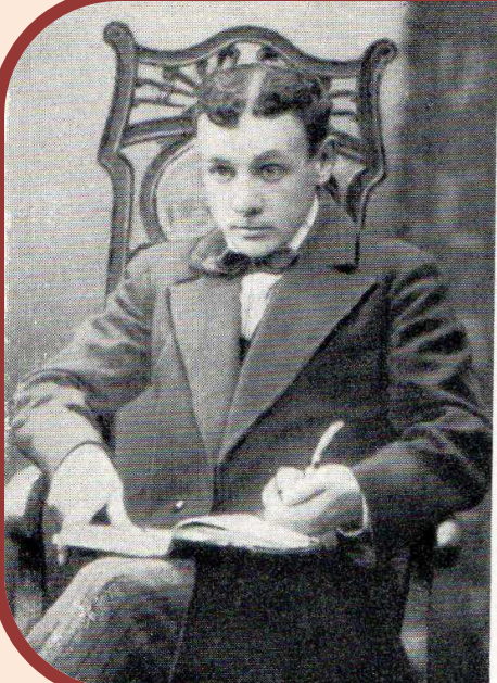
Александр Александрович Сумароков — антрепренер Нижегородского театра в 1913—1916 годах