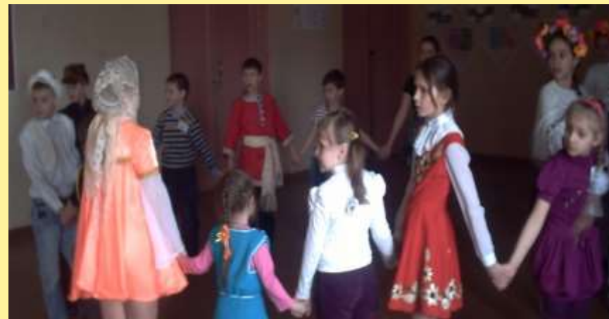
Совместные спектакли для старших и младших ребят