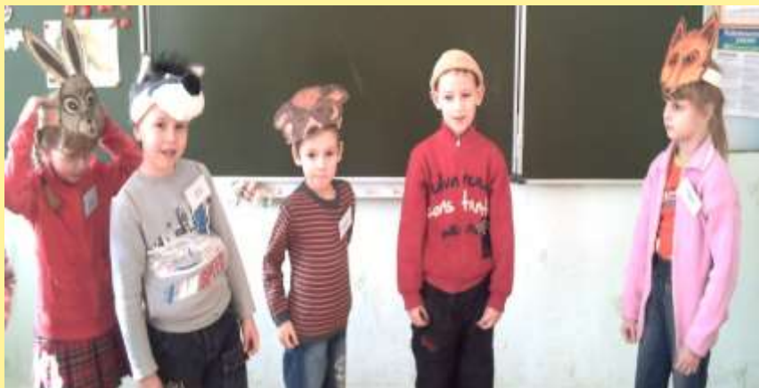
Сказки с «Школе будущего первоклассника»