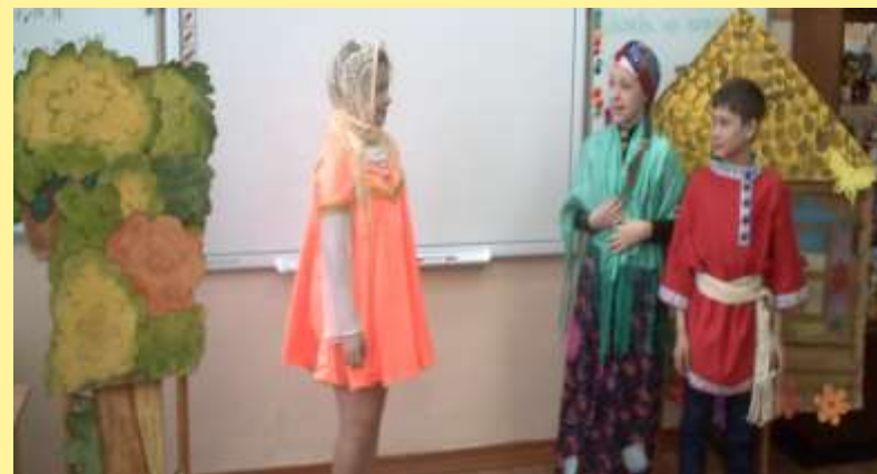
Выступления в классах школы